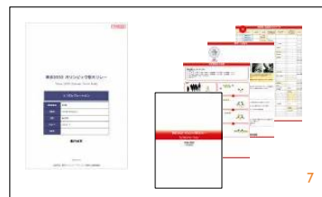
【マニュアル/台本作成】